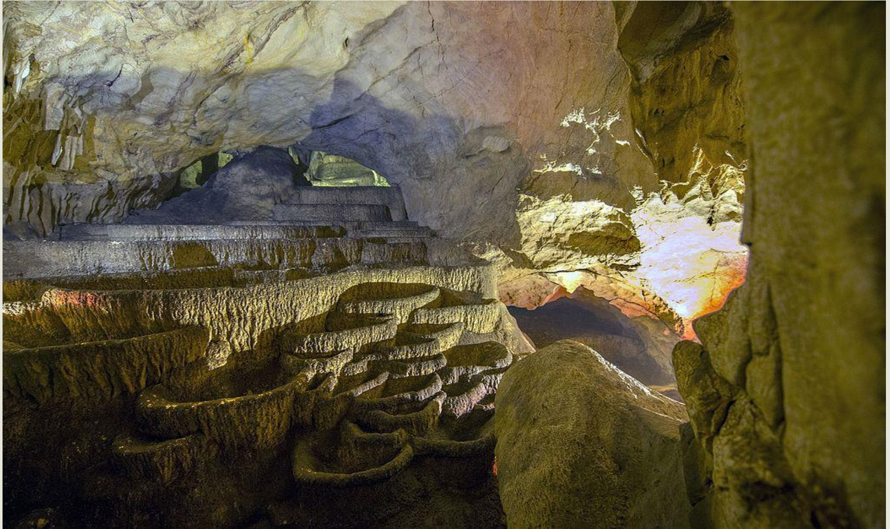
Fig 3. "Shpella e Radacit " Lokalitet Arkeologjik