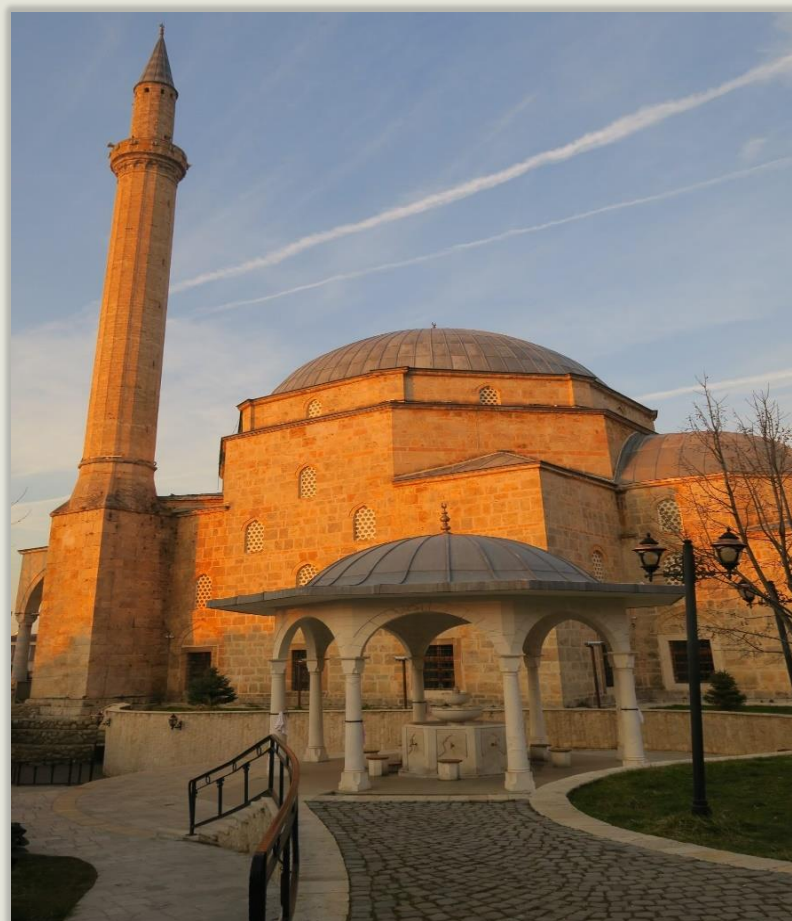
Fig. 1 Xhamia e Sinan Pashës Arkitektuale, Monument

R esurset kulturore janë pasuri kulturore, simbole që tregojnë vlerat e një shoqërie të caktuar. Ato shprehin identitetin kombëtar të një vendi. Kosova si vend njihet dhe është e pasur me resurse të shumta kulturore, që pasqyrojnë historinë dhe trashëgiminë kulturore të saj. Objektet si xhamitë, kishat katolike dhe ortodokse, kullat e vjetra shqiptare, urat, kështjellat, vendbanime arkeologjike janë objekte të trashëgimisë kulturore. Kosova gjithashtu përmban një trashëgimi të pasur etno-kulturore, materiale dhe shpirtërore me një shumëllojshmëri të periudhave historike duke u shquar për peizazhin e saj kulturor, arkitektonik, dhe gjeografik. Kultura dhe resurset kulturore janë pjesë e pandashme dhe shumë e rëndësishme e zhvillimit jo vetëm turizmit por ka ndikim edhe në zhvillimin ekonomik, duke ndikuar kështu edhe në krijimin vendeve të punës, përmes restaurimit, konservimit, menaxhimit dhe promovimit të mëtutjeshëm të saj.