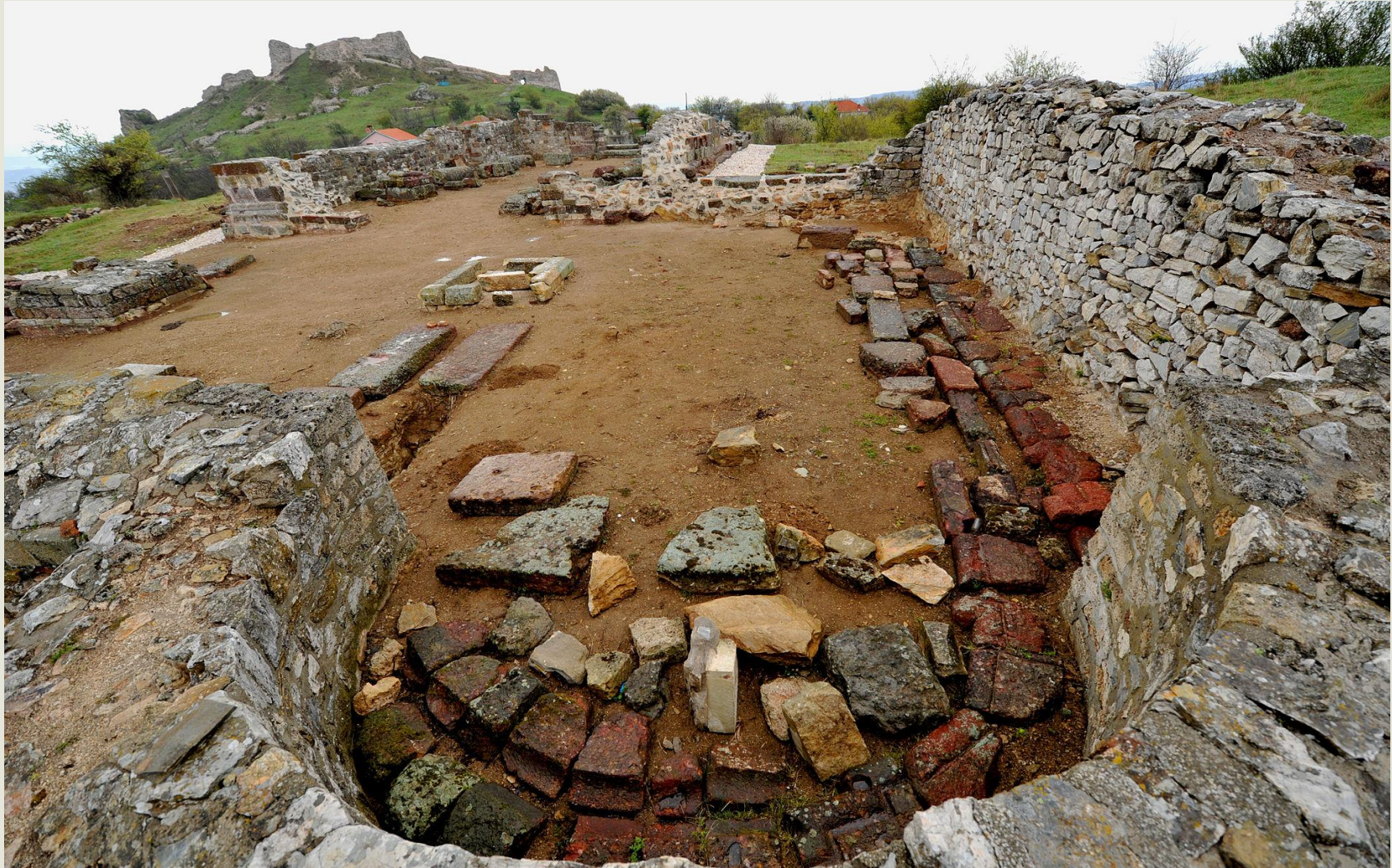
Fig. 2 "Gërmadhat e Katedrales së Artanës "