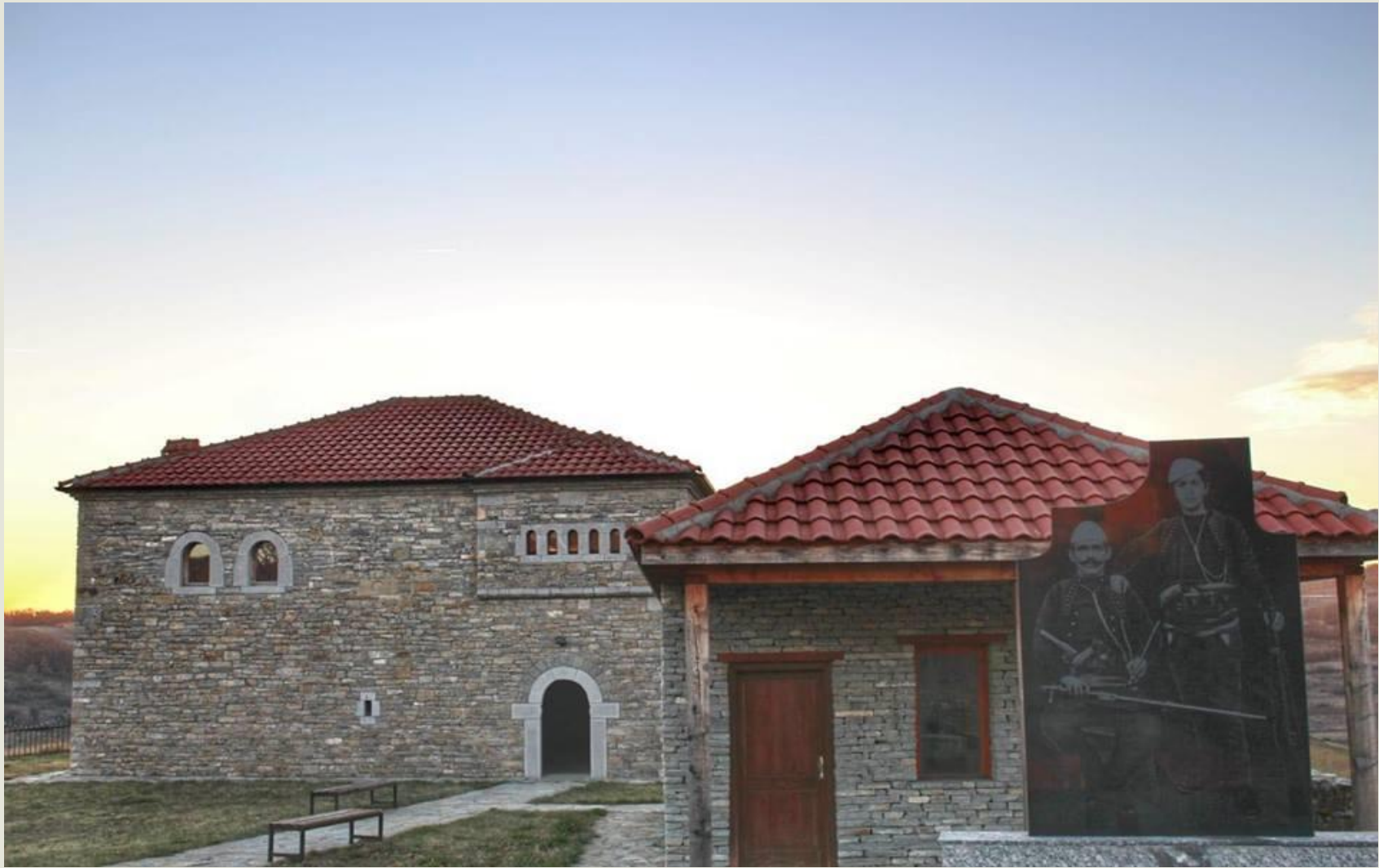
Fig.5 "Kulla e Azem e Shote Galicës" Monument/ansambël