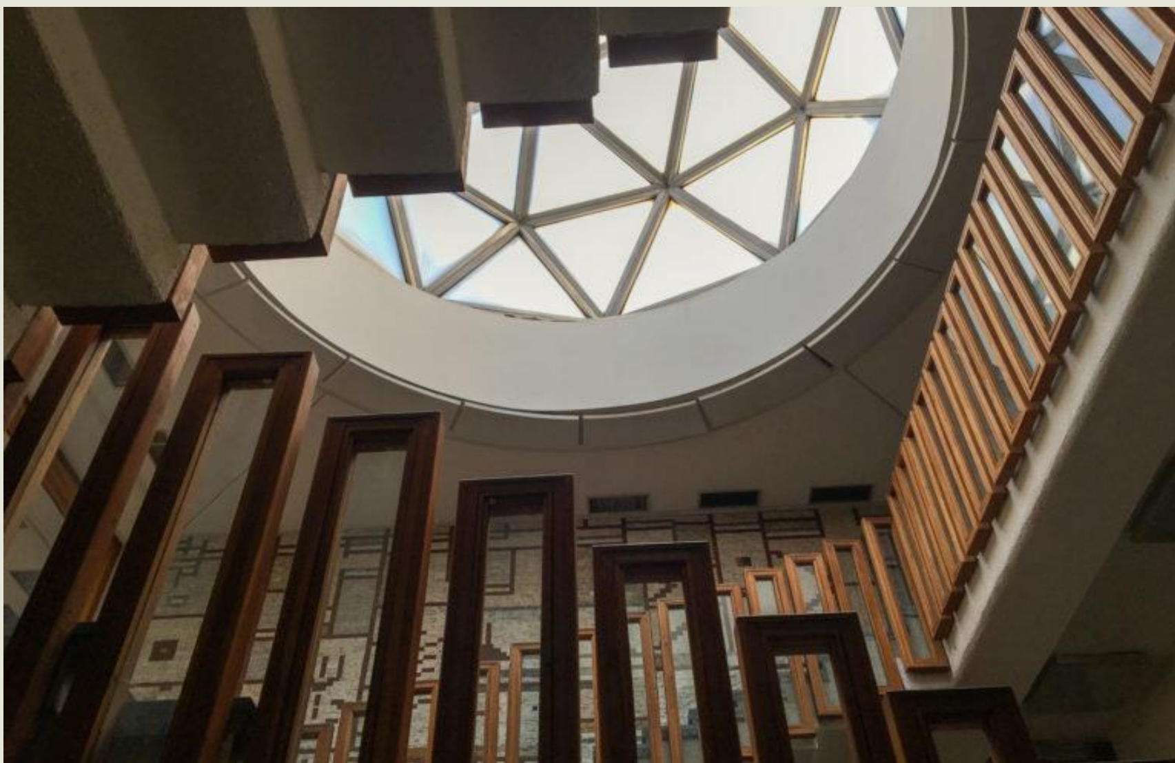
Fig. 4 Biblioteka Kombëtare e Kosovës "Pjetër Bogdani"