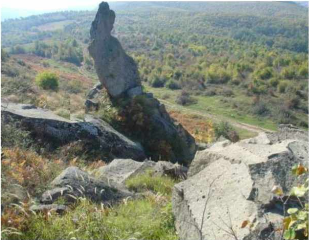
"Guri i Blinave në Gjylikar" - Viti