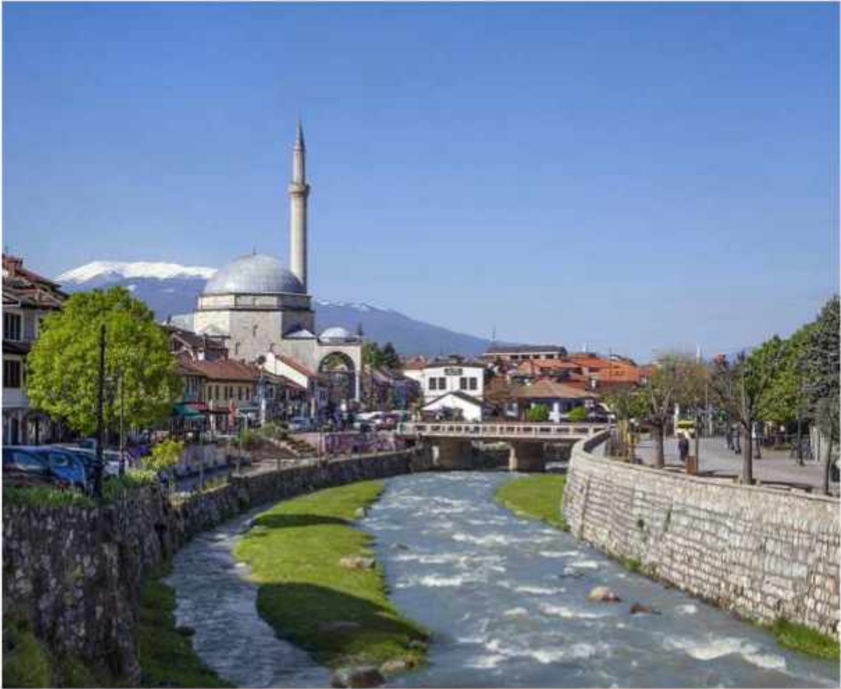
“Lumbardhi” - Prizren