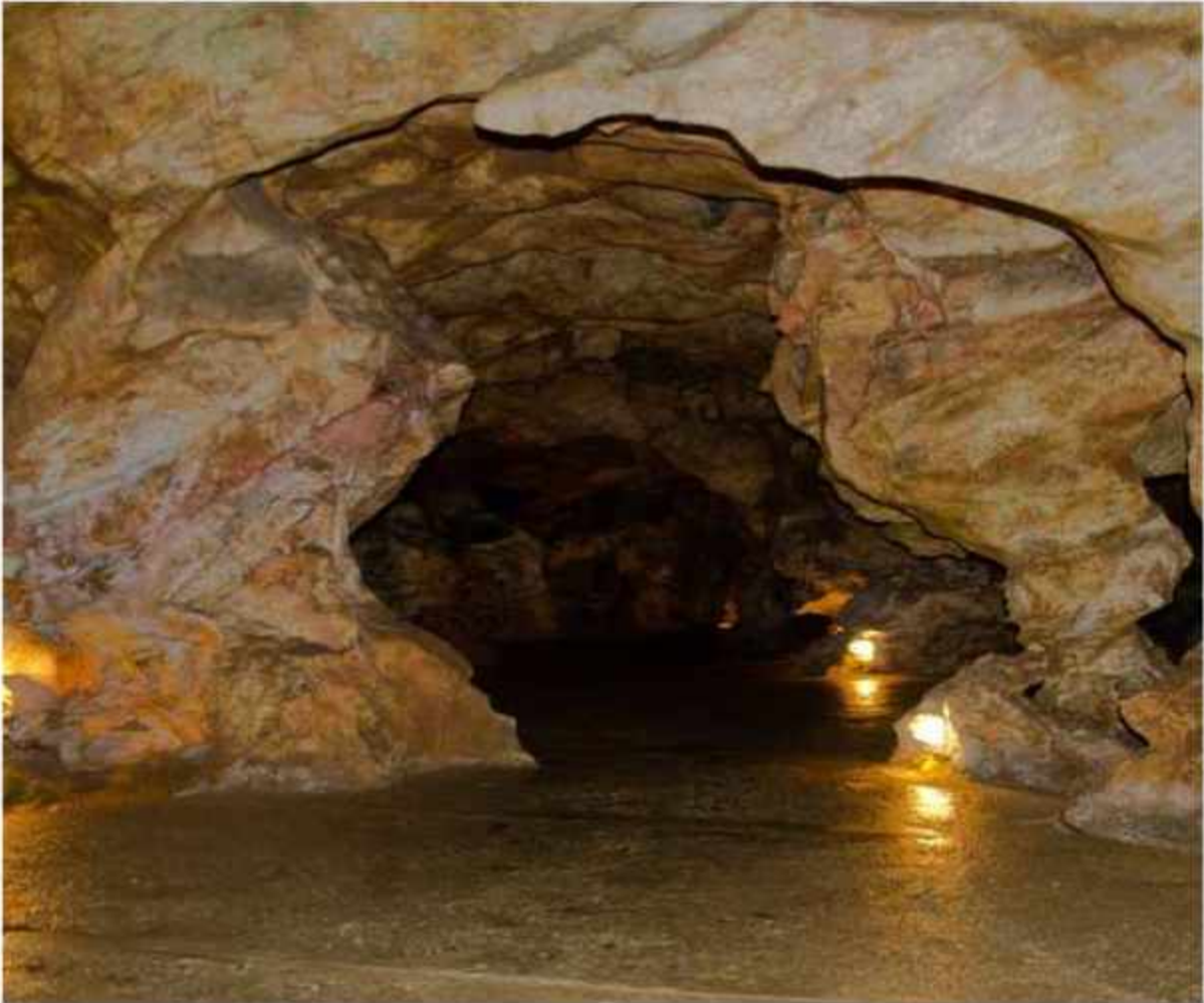
"Shpella e Gadimes" - Lipjan