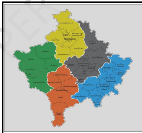
Slika 3. Mapa Kosova po klasifikaciji NUTS 3