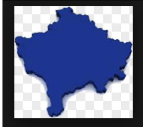
Slika 1. Mapa Kosova po NUTS 1 i NUTS 2

Sličnu klasifikaciju kompletne teritorije za NUTS 1 i NUTS 2 imaju ove države 8 :