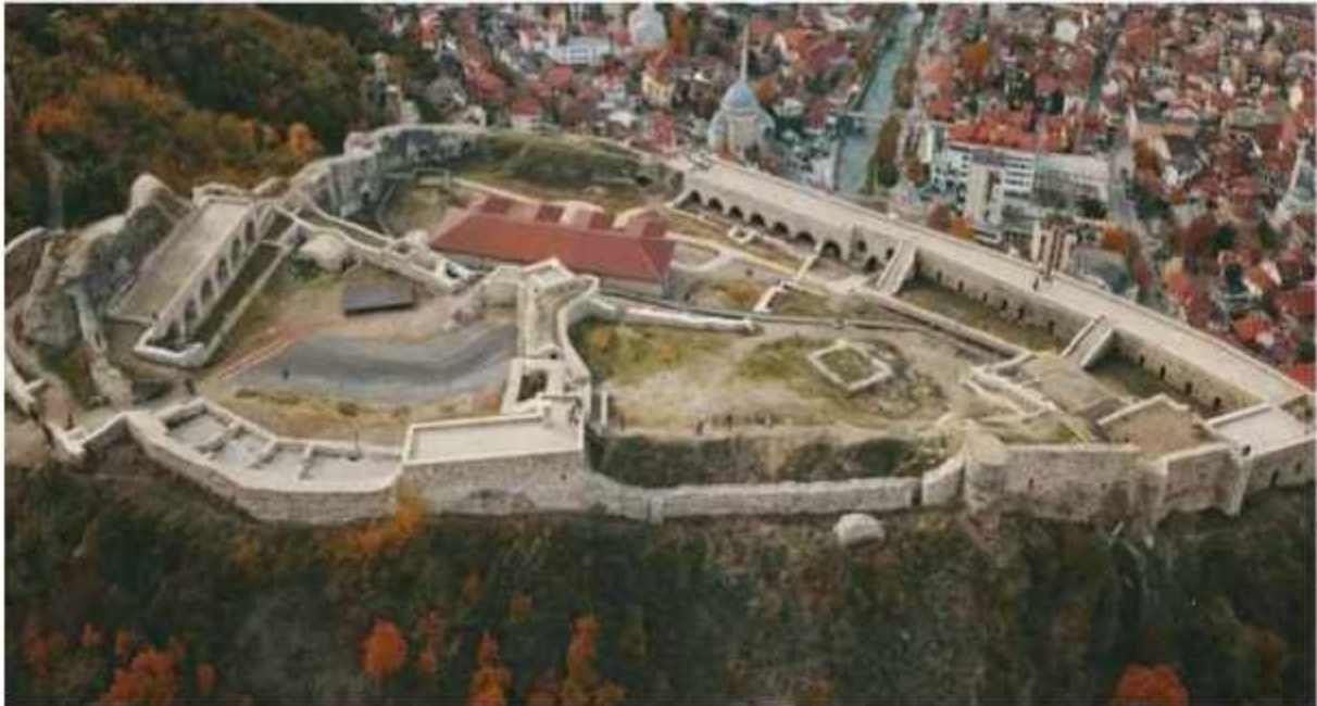
"Kalaja e Prizrenit"-Prizren