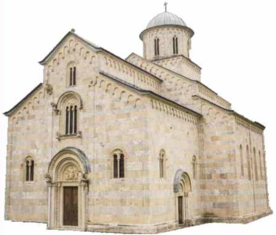
"Manastiri i Deçanit" - Deçan