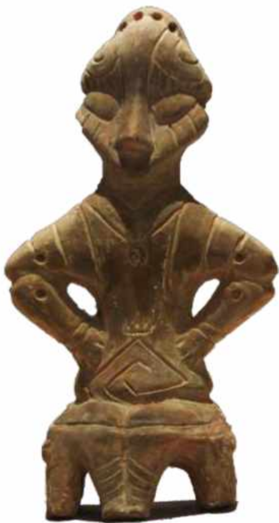
"Hyjnesha në Fron" - Prishtinë