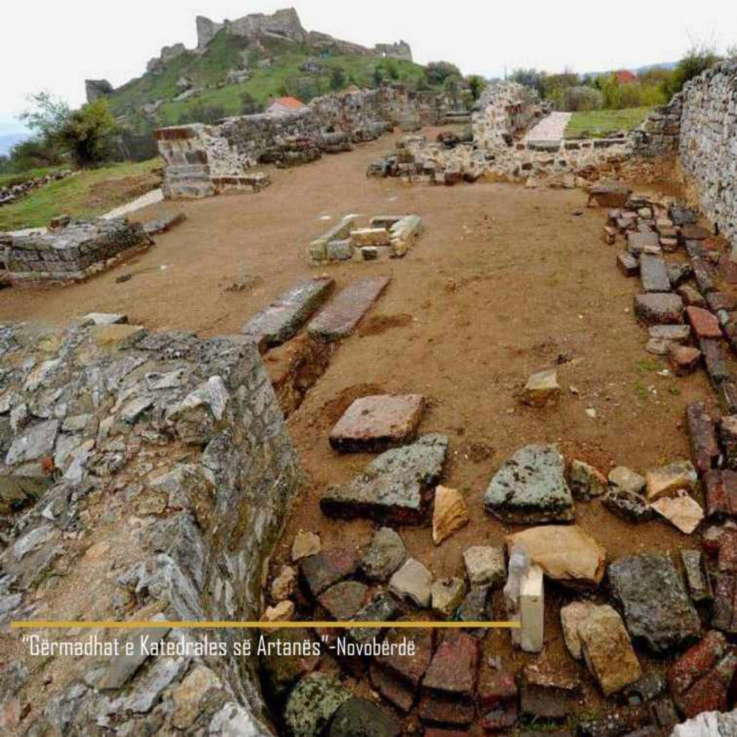
"Gërmadhat e Katedrales së Artanës"-Novobërdë