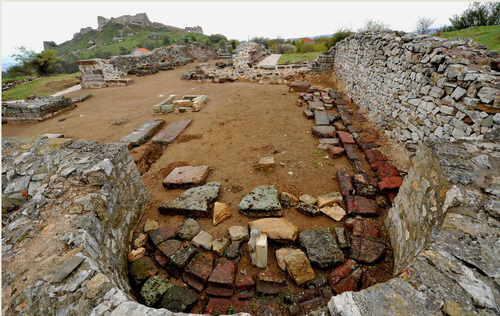
Slika 2 " Ruševine katedrale u Artani"