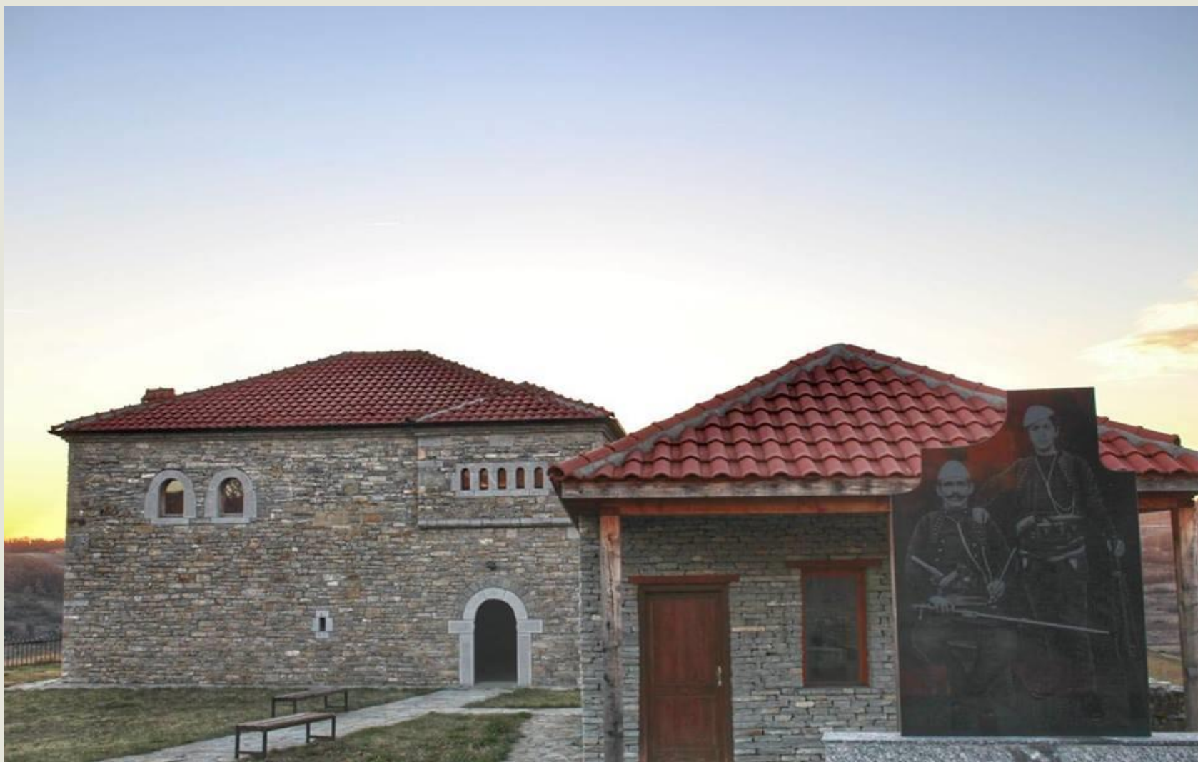
Slika 5 "Kula Azem i Šote Galice" Monument/ansambl